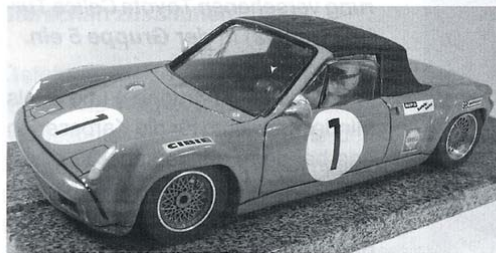
Einen Porsche 914/6 sah man wegen des kurzen Radstands in der Gruppe 4 eher selten. Dieter Sommer baute ihn.

Begrüßenswert aus Sicht der Gruppe 2/4/5 war ferner, daß das Plafit Pro Inlinerchassis (vgl. COL 5/2006, S.60) in 2006 wieder den Weg in die Regale fand und so das vorhandene Chassisangebot von Motor Modern KJ2 und Schöler Tigre Inliner für die Gruppe 2 wieder erweiterte.