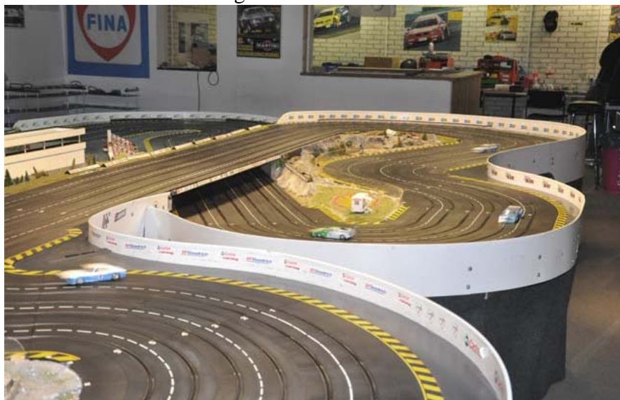
Die entscheidende Bergab Passage . . .

Nee Leute, nicht mehr zum Kurs in Schwerte!! Hier gilt die „bunter Hund“ Regel – in unzähligen WWW wurde zu den bekanntesten 30m Plastik des Westens alles geschrieben . . . !☺