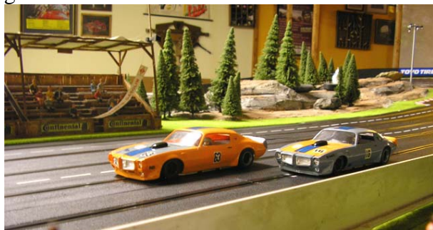
Trans-Am der Klasse 2 in Duisburg ...

Wie üblich werden die (h)eiligen Hallen um 9:00 Uhr geöffnet und bis zur Stromabschaltung um 11:30 Uhr besteht die Möglichkeit, die letzten Trainingssitzungen zu absolvieren. Um 12:00 Uhr wird es dann ernst: Die erste Startgruppe der Klasse 1 wird auf die Reise geschickt!